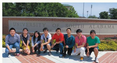
赴美学习的部分学生合影

近年来，学院不断强化与境外高水平大学的合作交流，建立教学科研合作平台，共同开展人才培养、科学研究，提升合作办学层次。实行与美、德、加、英、日、澳等地 13 所高校学分互认、课程互认，共同实施“2+2”、“1+3”、“3+1+1”联合培养模式。闽台合作方面，与台湾 4 所高校建立了联合办学关系，深入开展教师访学、学生交流、科研合作等。