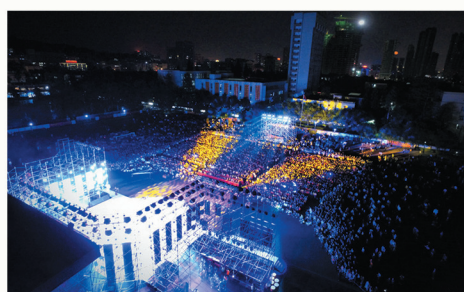
甲子峥嵘，十五芳华；薪火相传，辉煌同庆。我院隆重举行建校15周年庆祝大会暨校庆晚会