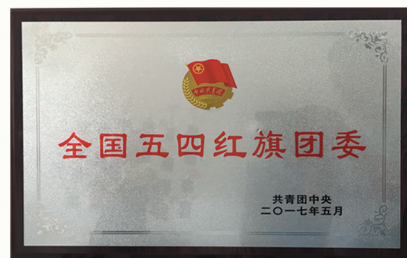
我院团委喜获共青团中央最高荣誉“全国五四红旗团委”称号

经常性邀请名师名家做客“至诚论坛”、举办“自信至诚”学生论坛，推行“院长进至诚课堂”教学活动，力邀福州大学相关学院院长为至诚学生授课；注重各类学生社团培育，拥有学术理论、科学技术、文化体育、文学艺术等 60 多个学生社团，以及计算机创新团队、机器人创新团队、电子设计团队等学科团队，推进校园高雅文化和校园自有文化品牌建设，造就文艺新星和多才学子。学院团委荣获“全国五四红旗团委”称号。