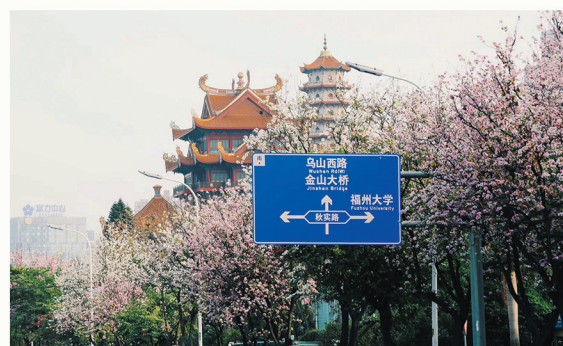
位于福州大学创始地怡山校区,文化底蕴深厚,学术氛围浓郁,环境优美雅致,地理位置优越,交通便利快捷

坐落在“魅力闽都,有福之州”的福建省会城市——福州市市中心鼓楼区,毗邻风景点、商贸中心和创意园,空气质量清新,地理位置优越;校区位于福州大学创始地——杨桥西路福州大学怡山校区,坐拥福州大学国家级大学科技园(I区)、国家高新技术转移海峡中心(火炬高新技术产业园)、福建省创新创业孵化基地、福州高新区洪山园、福州大学怡山文化创意园,文化底蕴深厚,学术氛围浓郁,环境优美雅致。