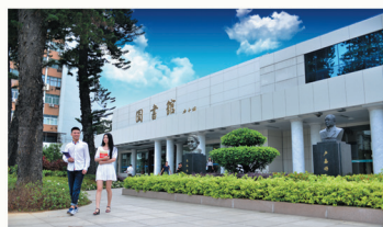
馆藏资源丰富的图书馆

图书文献、馆藏资源丰富,藏书百万余册,还能共享福州大学图书资源;教学实验实训中心完备,校企实践实习基地丰富;后勤服务保障能力先进,教室宿舍食堂配备空调,食宿条件优越舒适,体育健身设施一流。