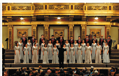
我院学生合唱团赴欧洲参加“唱响五洲”2019国际青少年艺术节荣获A等级暨金奖