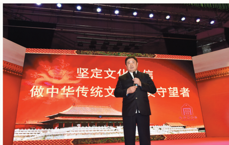
文化和旅游部党组成员、故宫博物院院长单霁翔为我院师生作“坚定文化自信——做中华优秀传统文化的忠实守望者”专题报告