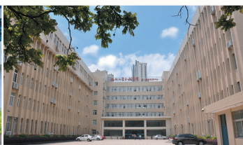
完善的实验、实训教学设施和体系