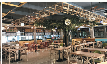
至诚人的食堂——菜品丰盛、美味可口