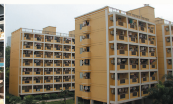
教室、宿舍、食堂“空调全覆盖”